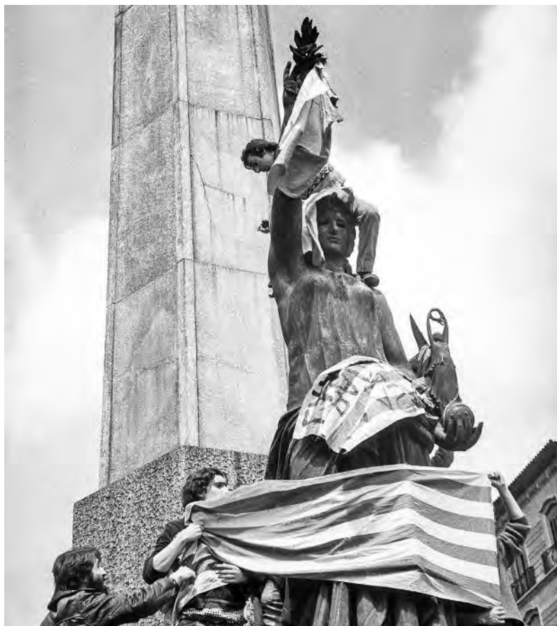
El monument franquista de la cruïlla del passeig de Gràcia i la Diagonal, inicialment dedicat al líder republicà Francesc Pi i Margall, cap al migdia de l'1 de febrer de 1976.

crits de rebuig a la seva actuació, feren baixar els passatgers i alguns foren estossinats a cops de porra.