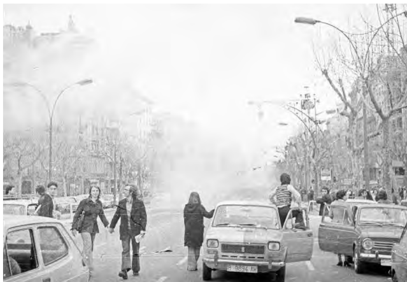
La participació automobilística fou fonamental durant les jornades de l'1 i el 8 de febrer de 1976.

En aquell moment, ja era clar que la ciutat sencera compartia el desig de llibertat. Certament, la majoria dels que es manifestaven eren joves, nois i noies que rarament passaven dels trenta anys, però la resta de la ciutadania els feia costat. Des de les finestres i els balcons el veïnat aclamava els manifestants, els advertia dels moviments policials, els obria la porta de l'escala perquè s'hi poguessin refugiar. Bars i pastisseries també acolliren moltes persones en situació de perill imminent. La policia, sorpresa per la magnitud de la protesta, no faria altra cosa que anar d'un lloc a un altre, desbordada per l'extraordinària mobilitat de la gent.