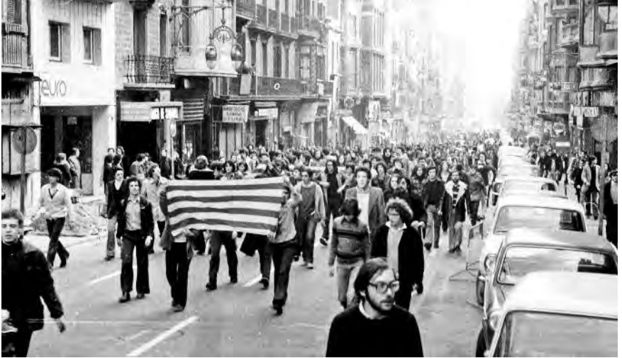
Després dels enfrontaments als jardinetes de Gràcia, els manifestants es van reorganitzar al carrer Gran de Gràcia.

cartes, ahora que s'organitzà un caos circulatori imponent gràcies a la col·laboració, un cop més, dels automobilistes. En arribar la policia, els manifestants es defensaren amb pedres i improvisaren precàries barricades amb tanques d'obra i algun cotxe, per marxar tot seguit carrer Gran de Gràcia amunt.