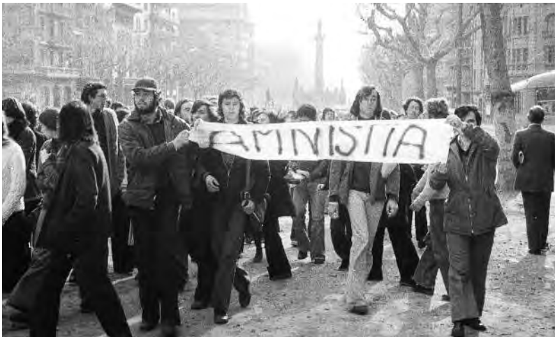
Les reivindicacions de l'Assemblea de Catalunya sintetitzades amb un lema que esdevindria cèlebre: Amnistia!

L 'Assemblea de Catalunya agrupà la gran majoria de l'oposició democràtica catalana, partits, sindicats i entitats socials i culturals, a més de nombrosos artistes, intel·lectuals i professionals de diversos àmbits, amb l'objectiu comú de la recuperació de les llibertats socials, polítiques i nacionals. Fundada el 7 de novembre de 1971 a l'església de Sant Agustí —situada a la plaça del mateix nom, al carrer de l'Hospital—, l'Assemblea de Catalunya, des de la més estricta clandestinitat, esdevindria la plataforma unitària per excel·lència de la lluita anti-franquista durant els darrers anys de la dictadura, amb una sèrie d'accions reivindicatives de gran repercussió.