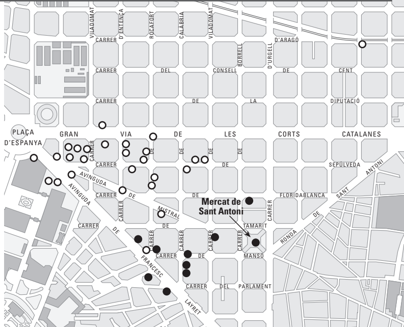
IMPACTES REGISTRATS PER LA JUNTA DE DEFENSA PASSIVA.

i de Sant Antoni, especialment l'avinguda de Francesc Layret (Paral·lel) i els carrers del voltant. Entre els edificis tocats hi ha el del mercat de Sant Antoni i el cinema Amèrica. A les tres de la tarda hi ha el dotzè bombardeig, altre cop sobre l'avinguda Francesc Layret, avinguda Mistral i els carrers adjacents fins a la Gran Via. Un garatge situat a la cantonada dels carrers Aragó i Muntaner també és tocat per les bombes.